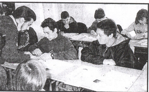
Cuatro momentos de la semana de la cultura del Instituto de Alcañices

Bueno no os creáis que todos los alumnos y alumnas fuimos a todas las actividades, sino que unos días antes elegimos aquellas que más nos gustaban y nos repartimos por ellas para llenar todo el tiempo de los tres días. Esta semana nos ha gustado mucho aunque hemos acabado más cansados que en clase y eso que nos hemos divertido mucho más. Ya le estamos pidiendo a la directora y a los profes que organicen otra para el próximo curso, aunque ellos nos dicen que tranquilos que resulta difícil y además cuesta mucho dinero, que este año se