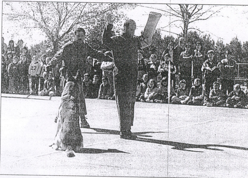
Un momento de la exhibición que fue seguida por cientos de niños de la zona

La demostración se realizó en la cancha de fútbol sala donde los niños y jóvenes se rompieron las manos a aplaudir ante la pericia