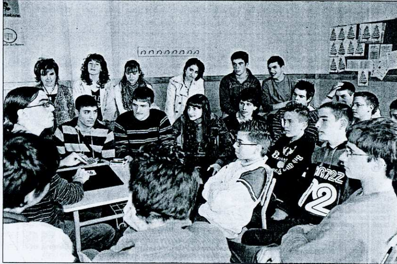
Alumnos del IES "Aliste" de Alcañices siguen con atención los juegos de magia

El programa, amplio y llamativo, muy interesante para todas las edades, ha abordado variados temas, entre otros, teoría y práctica de seguridad vial con karts y quads de "Aliste Aventura"